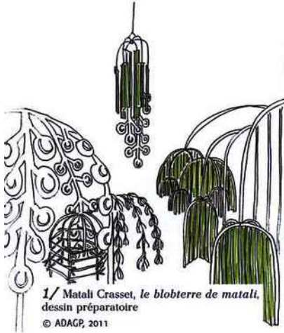
1/ Matali Crasset, le blobterre de matali , dessin préparatoire © ADAGP, 2011