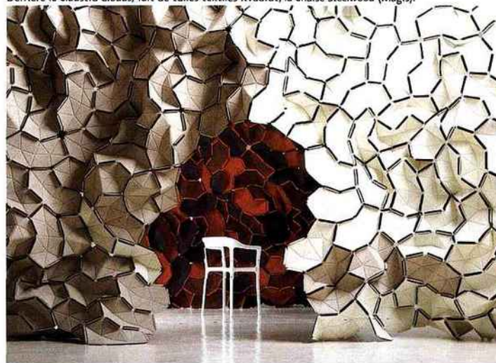
Derrière le claustra Clouds , fait de tuiles textiles Kvadrat, la chaise Steelwood (Magis).