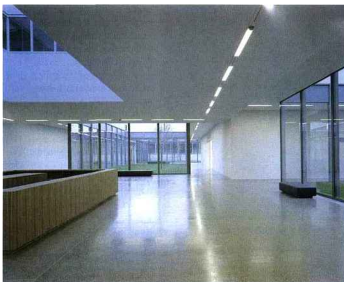
Le hall de l'aile sud du nouveau Museum Folkwang, Essen.

□ Le Chipperfield nouveau est arrivé ! L'architecte britannique, basé à Londres, Hambourg et Milan, qui accumule récompenses et distinctions, a livré, le 28 janvier, l'extension du Musée Folkwang, à Essen (Allemagne). Qualifié en 1932, en raison de la richesse de ses collections, de « plus beau musée du monde » par Paul J. Sachs, cofondateur du Museum of Modern Art (MoMA) de New York, le Musée Folkwang explosait entre les murs sobres et étroits d'un bâtiment datant du début des années 1960. L'extension, depuis longtemps nécessaire, est enfin réalisée grâce au choix d'Essen comme capitale européenne de la culture en cette année 2010. De David Chipperfield, on connaît nombre de bâtiments solidement ancrés dans le sol, denses, presque lourds, où domi-