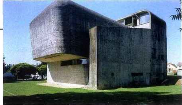
Claude Parent, église Sainte-Bernadette, Nevers.

À première vue, un parfum d'« inactualité » entoure l'œuvre de Claude Parent. Son travail nous parle en effet d'une époque déjà lointaine, où un brutalisme radical ramenait l'architecture au primitivisme, tandis que les campagnes françaises voyaient fleurir d'inquiétantes centrales nucléaires. Si ces deux utopies ont fané, la démarche de Claude Parent continue de fasciner les architectes contemporains et justifie une exposition à la Cité de Chaillot.