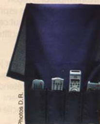
Un rangement télécommandes A poser sur l'accoudoir du canapé ou fauteuil, Flört, Ikea, 4,90 €.