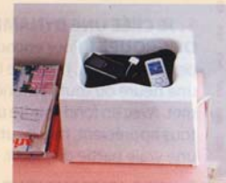
Un bloc chargeur. Avec 3 prises, j'y laisse tous les cordons. Signum, Ikea, 8,99 €.