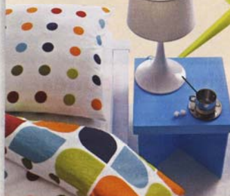
Une table modulable Range-revues, chevet, ou table basse, c'est au choix! L 40 cm, La Redoute, 34,90 €.