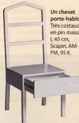
Un chevet porte-habits Très costaud en pin massif, L 45 cm, Scapin, AM-PM, 95 €.