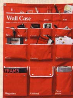
Un vide-poches. Pour tout ce qui traîne, L 75 cm, Wall Case, Home autour du Monde, 45 €.