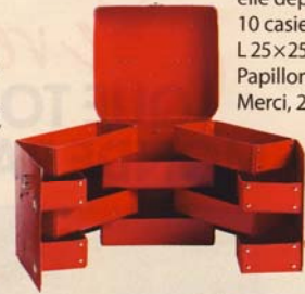
Une boîte épatante Ouvverte, elle déploie 10 casiers, L 25x25 cm, Papillon, Merci, 25 €.