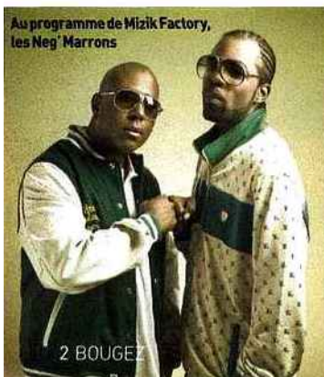
Au programme de Mizik Factory, les Neg Marrons