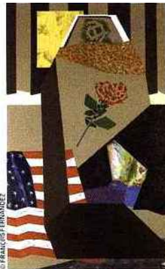
Fumer n'empêche pas de mourir à Guantanamo), 2008, acrylique sur toile, Noël Dolla

Tram, réseau art contemporain Paris Île-de-France, programme tous les mois un « taxi tram », promenade artistique d'une journée ou demi-journée, incluant le transport en bus, l'accès aux sites et leur visite guidée. Celle du Mac/Val est comprise dans le programme du taxi tram du samedi 25 avril 2009, avec le musée Zadkine et la Galerie de Vitry. Inscription obligatoire uniquement par e-mail : taxitram@tram-idf.fr Renseignements sur www.tram-idf.fr