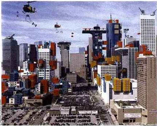
Dinner Time, 2005, Alain Bublex