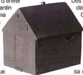
La Obama White House bleue et deux "maisons du désastre" en nickel gris, design Constantin et Laurene Boym.

Une nouvelle miniature vient d'entrer dans le catalogue de Constantin et Laurene Boym : la Obama White House, la Maison Blanche version rêve américain, éditée dans une série limitée à 1000 exemplaires, dans une résine bleue lumineuse, travaillée à la main, numérotée et signée. Elle vient marquer une élection historique et apporter un élément positif dans leur catalogue "Souvenirs d'une fin de siècle" qui depuis 1998 collectionne les reproductions de bâtiments dramatiquement marqués, "Houses of disaster". L'initiative était originale mais quelque peu déprimante. Elle offrait une vision différente de l'architecture, un parcours atypique et populiste de bâtiments célèbres en bâtiments célèbres marqués par des événements terriblement dramatiques : les Twin Towers, la centrale de Tchernobyl, le Pont de l'Alma, le bâtiment fédéral d'Oklahoma City... Malgré leur triste référence, les miniatures se sont vendues avec succès, elles sont toutes "sold out", épuisées. L'arrivée de Barack Obama à la Maison Blanche offre une nouvelle approche. Une maison de l'espoir vient s'inscrire en bleu et résistance aux maisons du désastre.