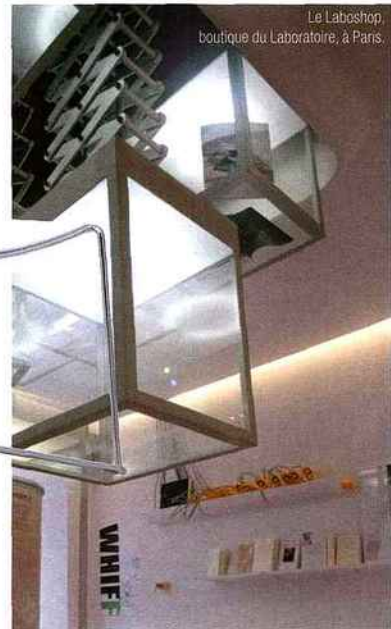
Le Laboshop, boutique du Laboratoire, à Paris.

Au Laboratoire, rue Bouloi à Paris, en sous-sol et sous les miroirs en mirologie d'un plafond qui reflète chacun de ses gestes, Thierry Marx fait des fritures polaires de pamplemousse et cuit le chocolat dans un bain d'azote liquide à -196°. Il a fallu interroger la science avant d'agir, effectuer un décodage savant avant de passer à l'action mais depuis 1989 et la première démonstration chez Gaston Lenôtre, la cuisson à l'azote liquide n'a rien perdu de son spectaculaire et cuisant effet. "La modernité dans la cuisine, explique Thierry Marx, c'est vivre des émotions. Les gens veulent voir ce qui se passe" et Thierry Marx utilise les chocs thermiques à bon escient, déstructure les produits pour leur donner un sens. La technique à l'azote ne fonctionne pas seule et sans un produit majeur. Le rhum version parmesan, la crème en bâton glacé... la cuisine, ça se regarde, ça se médite et ça se mange. Tentation, plaisir, frustration ou les trois temps d'une expérience culinaire à vivre avec ses amis au Foodlab (Adhésion : 50 euros), sous les espaces du LaboBrain, bureau personnel et cellule de réflexion de David Edwards et du LaboShop boutique du Laboratoire où l'on peut acheter le "Whiffer", alternative salvatrice à la cigarette.