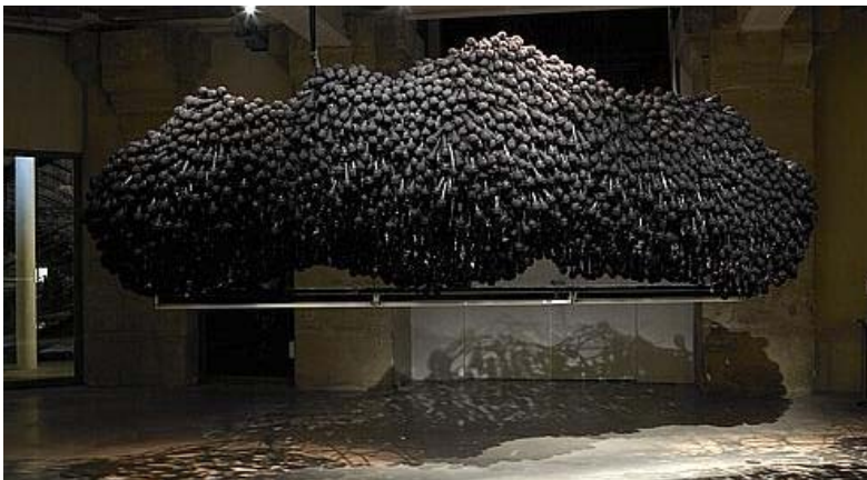
Singing Cloud - Assemblage de micros et d'éléments sonores. Marc Damage

Valérie Duponchelle (Figaroscope) 25/02/2009 | Ajouter à ma sélection