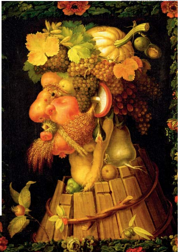
1. Tableau piège (1965) immortalisé par Daniel Spoerri au restaurant de la City Galerie à Zurich. 2. Daniel Spoerri. 3. L'Automne (1573) du peintre maniériste Giuseppe Arcimboldo. 4. La fameuse boîte de soupe Campbell's déchirée (1962) signée Andy Warhol.